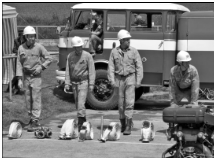
Účasť našich hasičov na súťaži

né zachraňovať, čo sa ešte dalo, pretože sa vo vnútri nachádzala aj plynová bomba. Družstvo hasičov vlastní hasičské auto Aviu - 31 špecial, PPS-12 prenosnú požiarnu striekačku, ako i 2 ks genfovakov na hasenie lesných požiarov.