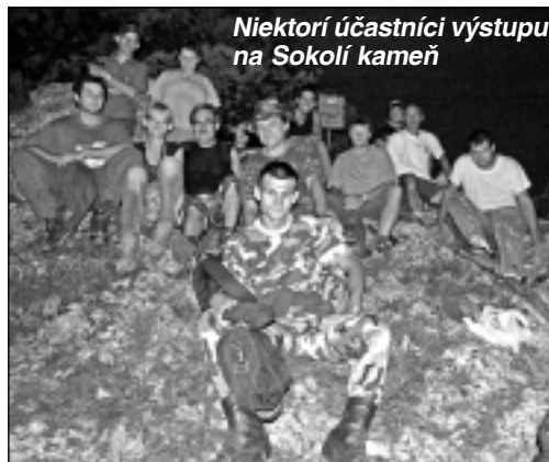
Niektorí účastníci výstupu na Sokolí kameň

Obecný úrad Chochoľná-Veľčice v spolupráci s kultúrnou komisiou usporiadali pre všetkých priaznivcov turistiky a pohybu v prírode už piaty krát Nočný výstup na Sokolí kameň (696,5 mnm). V sobotu podvečer 12. júla 2008 (sobota) vyrazila hore na vrchol asi tridsiatka