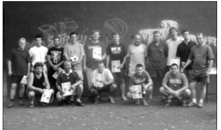
Účastníci 6. ročníka nohejbalového turnaja v obci.