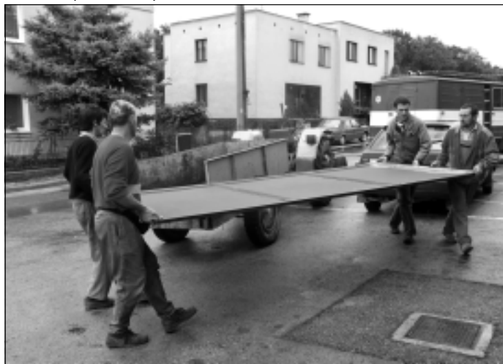
Brigáda hasičov na budove požiarnej zbrojnice

OBEČNÉ NOVINY - štvrtročník obyvateľov obce Chochoľná-Veľčice, ročník XI., číslo 1-2008. Vydáva Obecný úrad Chochoľná-Veľčice. Vychádza vo vydavateľstve DELTA, Jirí Faldyna tel.: 0905/259315, e-mail: delta@naex.sk, http://www.delta.ismo.sk . Adresa redakcie: Obecný úrad 913 04 Chochoľná -Veľčice, tel./fax (032) 6539100, 6539101, e-mail: obec@chocholna-velcice.sk, http://www.chocholna-velcice.sk . Šéfredaktor: Ing. Jozef Hošťák, zodpovedný redaktor: Blanka Hlavandová. Reg. číslo: OÚ Trenčín 97/01841-PT1 © DELTA