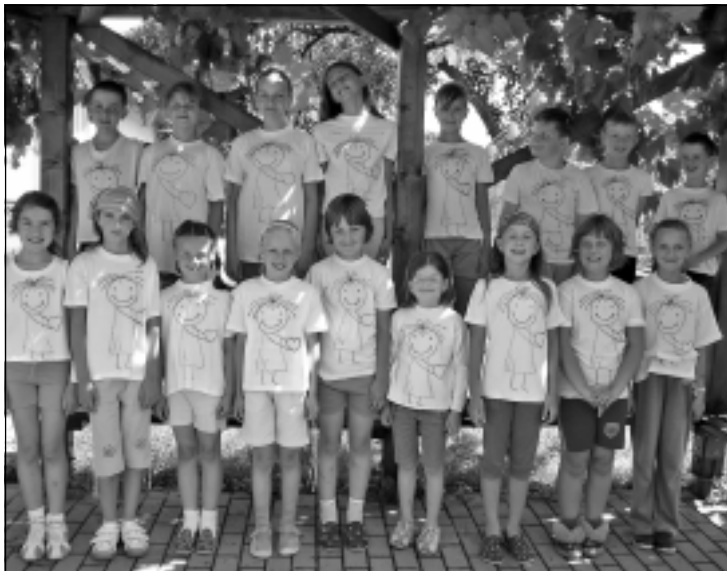
účastníci letného školského klubu

Sme malá škola, ale rovná sa môžeme s hociktorou veľkou školou. A právom. Veď naši žiaci okrem vyučovacích výsledkov dosiahli veľmi pekné úspechy v rôznych súťažiach. A to nielen v okresných, ale aj v celoslovenských a medzinárodných. Že žiaci našej školy učivo ovládajú, svedčia o tom aj výsledky. Veď až troch štvrtákov z našej malej školy prijali na gymnaziálne štúdium. Je to naozaj veľmi dobrý pocit. Je to skvelé vysvedčenie nielen pre nich, ale aj pre vyučujúcich.