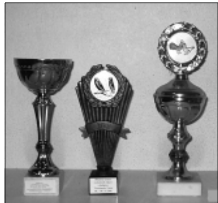
Vítané poháre - trofeje našich mladých chovateľov.