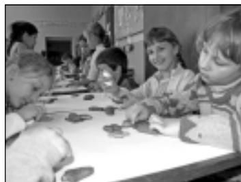
Žiakom sa zdobenie modovníčkov veľmi páčilo.

Čert a Mikuláš nezabudli na našu školu a na deti a navštívili nás aj tento rok. Všetkým žiakom školy za peknú báseň alebo koledu rozdali sladkosti.