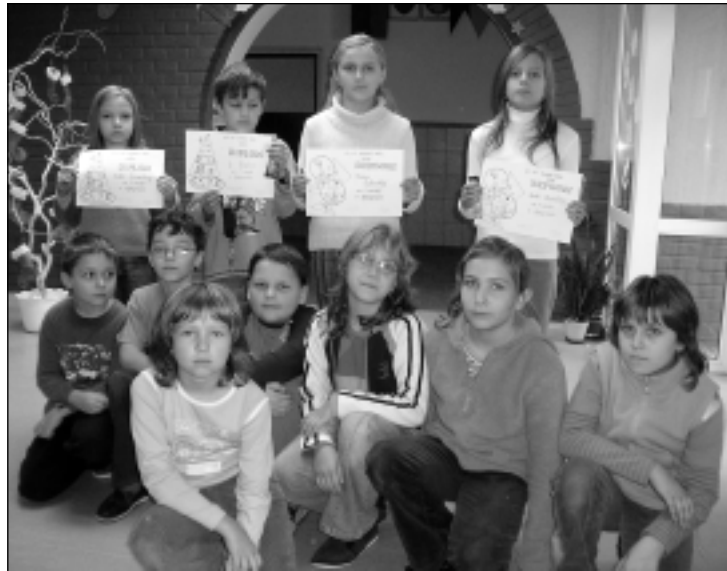
Na fotografii riešitelia matematickej súťaže Pytagoriády

V dňoch 21. a 22. novembra prebiehal v Trenčíne už 38. ročník speváckej súťaže ľudovej