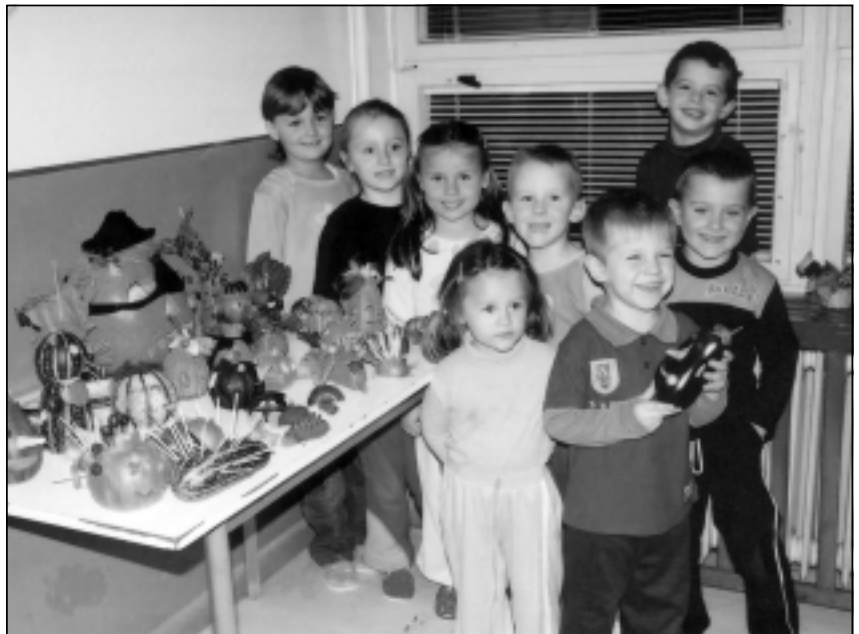
Jesenné tvorivé dielne, ktoré pre svojich malých žiakov pripravil kolektív učiteliek materskej školy. Deti si priniesli rôzne ovocie, zeleninu alebo malé ozdobné tekvičky a z nich vytvárali pomocou svojich rodičov a učiteliek rôzne figúrky, zvieratká a tekvicové hlavy svetlonosov.