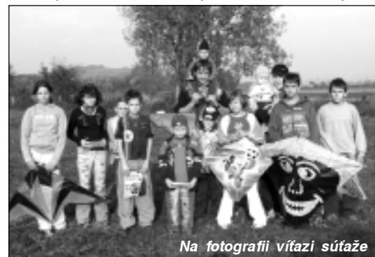
Na fotografii víťazi súťaže

Pre všetkých účastníkov bolo určite odmenou i príjemne strávené nedeľné popoludnie v spoločnosti známych a priateľov. Po vyhlásení výsledkov a odovzdaní cien si mohli všetci opiecť špeká-